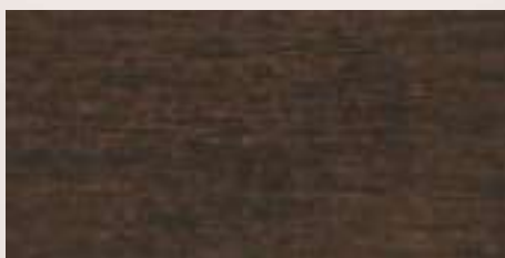
TECA CHOCOLATE • 716