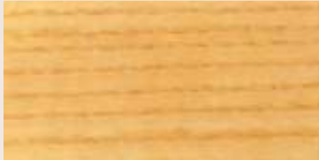
INCOLORO • 900